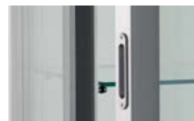
> Poignée de porte incrustée dans le chant de porte