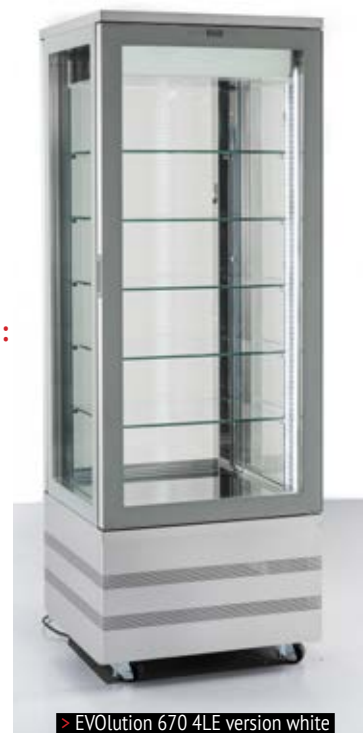
> EVOLution 670 4LE version white

Finitions extérieures sans supplément à préciser :