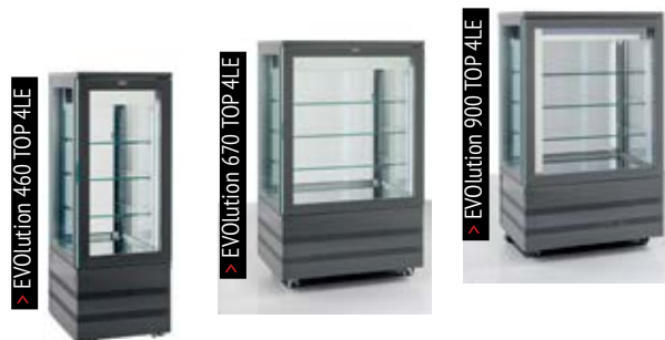
> EVOlution 460 TOP 4LE