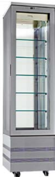
> EVOlution 460 4LE