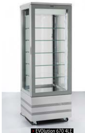
> EVOlution 670 4LE