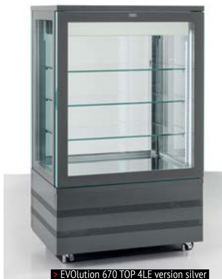
> EVOLution 670 TOP 4LE version silver