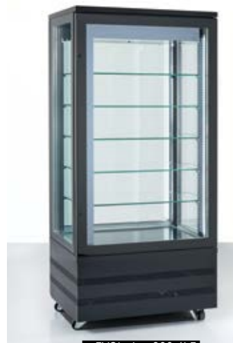
> EVOlution 900 4LE