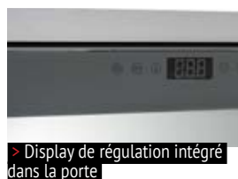
> Display de régulation intégré dans la porte