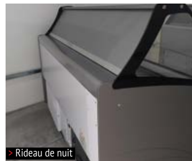
> Rideau de nuit