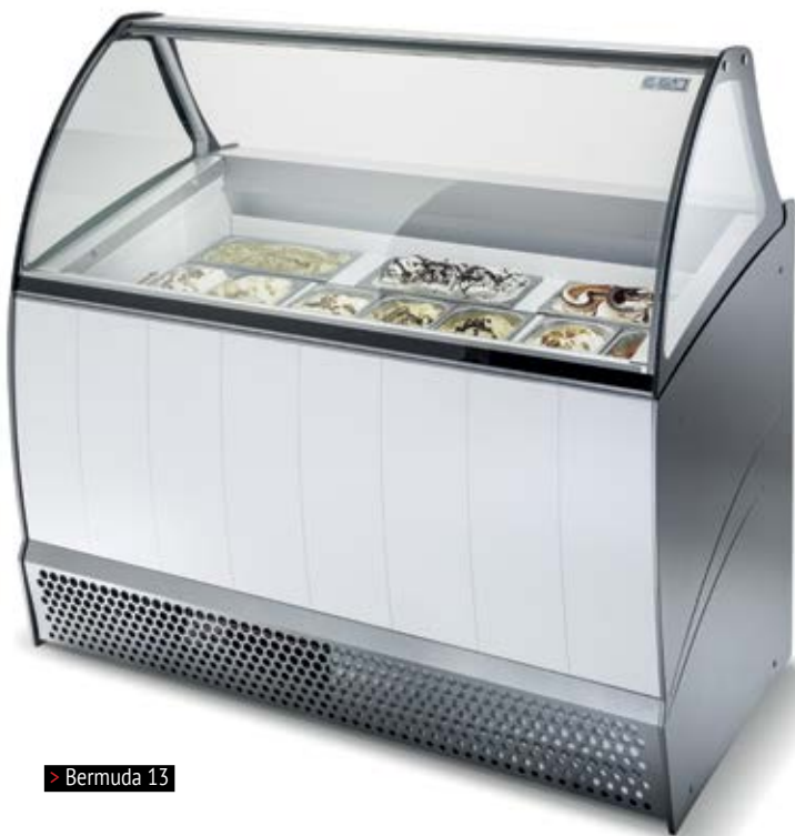
> Bermuda 13