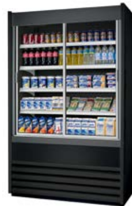
> Portes vitrées coulissantes en option