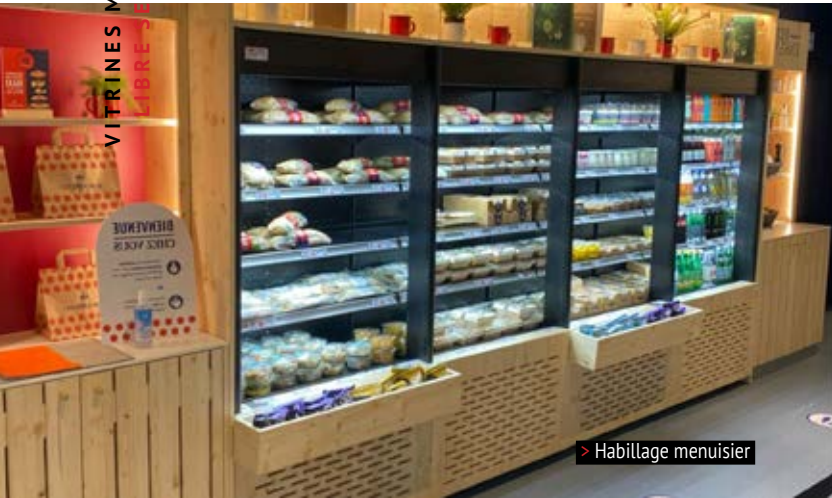
> Habillage menuisier