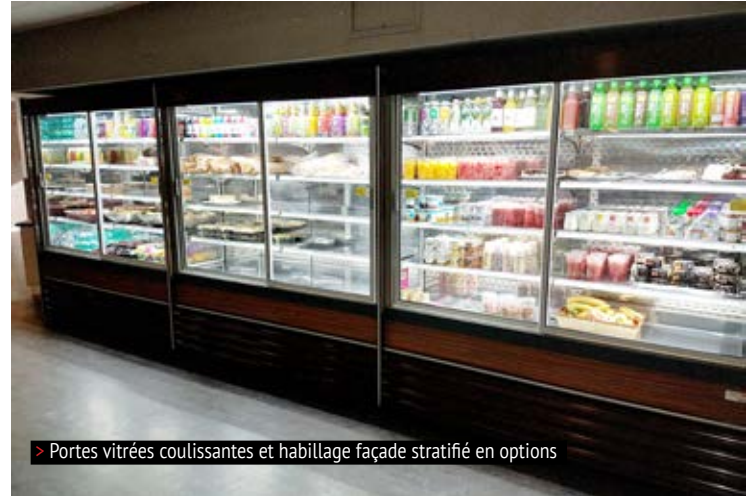
> Portes vitrées coulissantes et habillage façade stratifié en options